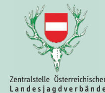
Zentralstelle Österreichischer Landesjagdverbände